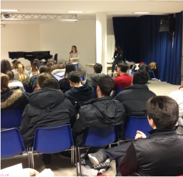
16 febbraio 2015