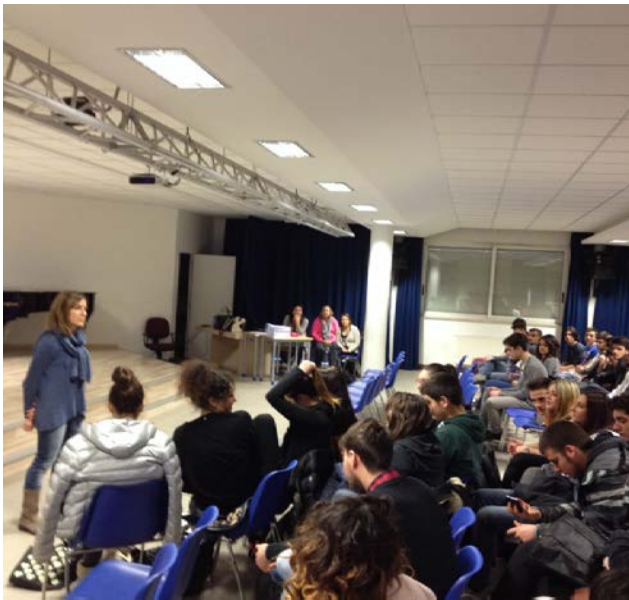
20 febbraio 2015