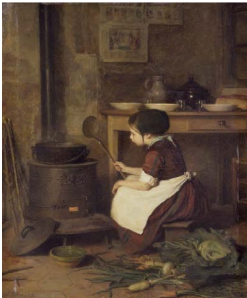
Pierre-Édouard Frère, La piccola cuoca (1858 circa), Brooklyn Museum di New York

Sono la famiglia e la scuola che per prime dovrebbero educare i bambini per evitare che la disuguaglianza di genere si trasformi, negli anni, in disuguaglianza sociale, nel lavoro e nella vita.