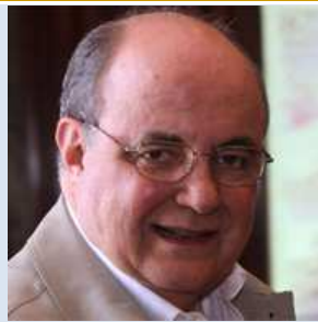
Di padre in figlio, Bompiani editore

Vittorio De Sica raccontato dal figlio Manuel. Una autobiografia congiunta che rilegge la vita e la carriera artistica del regista di capolavori del cinema, rendendo omaggio alla figura dell'artista, dell'attore ma anche dell'uomo e del padre.