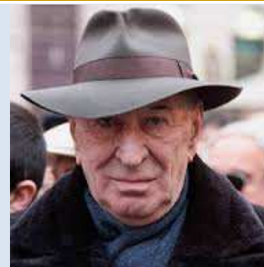
4 volte 20 anni, regia di Marco Spagnoli

La vita e la carriera di Giuliano Montaldo: uno straordinario cineasta italiano. È il ritratto di un grande regista e intellettuale, e al tempo stesso di una figura elegante che ha fatto del cinema la sua "vita" come pure un personalissimo strumento di ricerca sul piano civile.